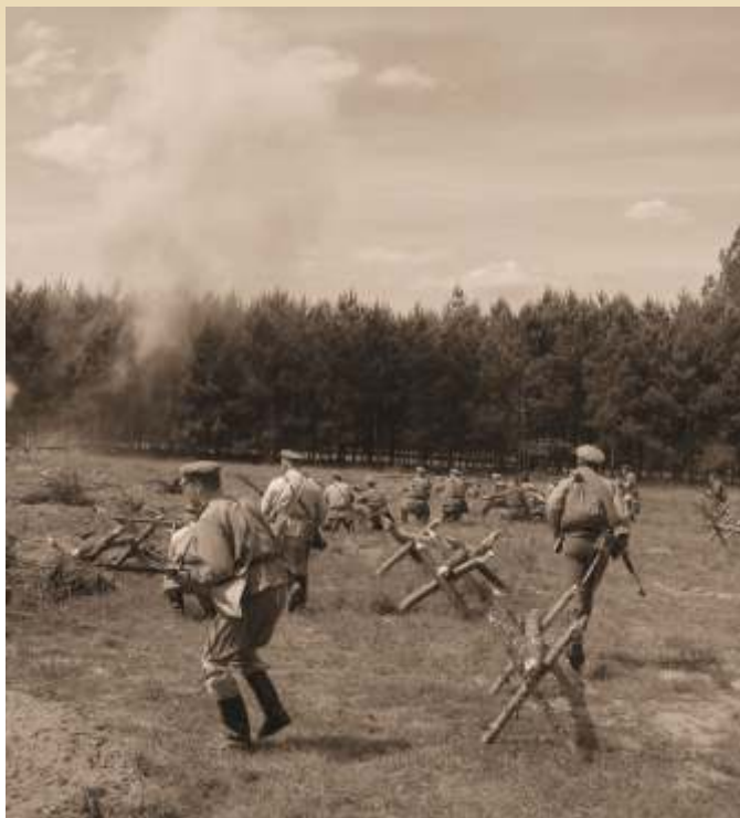
Atak piechoty rosyjskiej na pozycje niemieckie - rekonstrukcja wydarzeń

Już na początku października 1914 r. wojska niemieckie dotarły pod Warszawę. Zacięte walki toczyły się w trudnych warunkach. Z nastaniem zimy front ustabilizował się na linii Bzury i Rawki. Walczące strony przeszły do wojny pozycyjnej, pokrywając całą okolicę siecią okopów, podziemnych korytarzy, nor i ziemianek. Z nadejściem roztopów wilgoć panująca na pozycjach w okolicach Bolimowa , wśród błot i trzęsawisk, wywołała u żołnierzy epidemię duru plamistego, czerwonki oraz choroby nerek. Kryzys wojny pozycyjnej zmusił Niemcy do skorzystania z nowej broni - gazów bojowych - w zamyśle jej twórcy i entuzjasty, prof. Fritza Habera: „porażającej i przerażającej”.