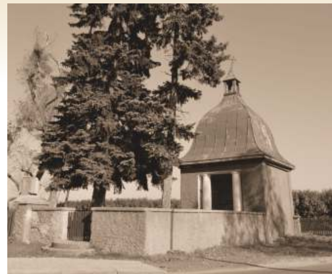
Cmentarz ofiar gazów bojowych pod Bolimowem - widoczna kaplica