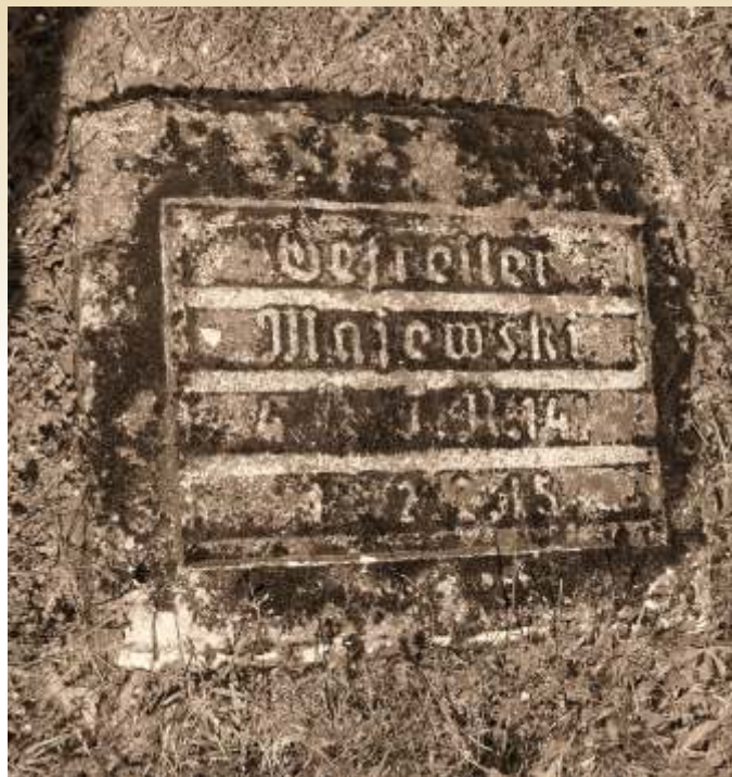
Jeden z wielu nagrobków Polaków - wcielonych do armii niemieckiej - cmentarz w Bolimowskiej Wsi

I wojna światowa - konflikt zbrojny trwający od 28 lipca 1914 do 11 listopada 1918 roku (w latach 20. i 30. XX wieku nazywany „Wielką Wojną”) pomiędzy Ententą, tj. Wielką Brytanią, Francją, Rosją, Serbią, Japonią, Włochami (od 1915 roku) i Stanami Zjednoczonymi (od 1917 roku), a państwami centralnymi, tj. Autro-Węgrami wspieranymi przez Turcję i Bułgarię. I wojna światowa toczyła się w Europie (również na terenie ziem polskich) Afryce, na morzach całego świata. Do wojsk państw zaborczych wcielono 3,4 mln Polaków - spośród nich 1,4 mln trafiło do armii austriackiej; 1,2 mln do armii rosyjskiej; 800 tys. do armii niemieckiej.