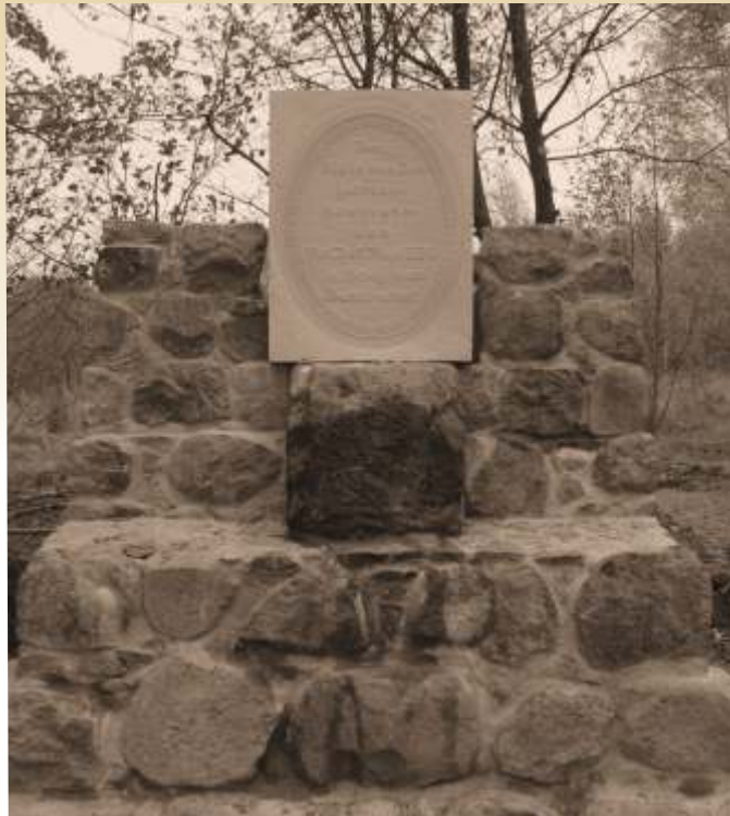
Cmentarz w Wólce Ląsiejkiej k/Bolimowa - płyta komemoratywna zrekonstruowana przez Łukasza Konopackiego

Dokładna liczba ofiar walk nad Rawką i ataków gazowych w okolicy Bolimowa nie jest znana. Według różnych źródeł miało w nich zginąć do 90 tys. żołnierzy obu stron. Ostatnie prace archeologiczne i odkrywanie kolejnych cmentarzy na terenie Puszczy Bolimowskiej pozwalają przypuszczać, iż ofiar może być znacznie więcej.