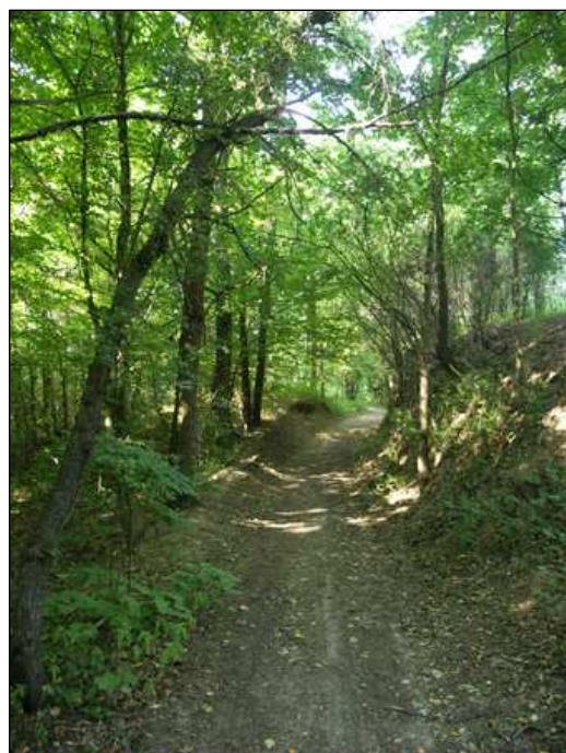
Fot. 2. Na zielonym szlaku

Utrudnienia: Szlak nie jest jednak odpowiednio oznaczony, na znacznych fragmentach trasy w ogóle brak jest oznaczeń lub oznaczenia są słabo czytelne, wręcz niewidoczne (wyblakłe), czasem mylące, bo stanowią oznaczenia szlaków już nieistniejących, nie zaś aktualnych, a do tego często kolor zielony wygląda raczej jak niebieski. Na fragmencie gdzie szlak zielony pokrywa się z żółtym oznaczenia nie są jasne, np. przez długi odcinek oznaczenia są wyłącznie żółte (rejon Bud Grabskich). Brak tablic i oznaczeń historycznych traktów (Trakt Miedniewicki, Józefowska Droga) powoduje łatwą utratę orientacji, co przy tak długim przebiegu szlaku (38 km) może wiązać się z niebezpieczeństwem zagubienia. Ponadto,