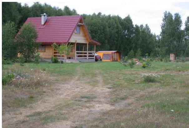
Fot. 11. Przykładowy domek letniskowy nie nawiązujący stylem do sąsiedztwa (Żuków)

Nie wszystkie działki są zabudowane domkami rekreacyjnymi. Najwięcej ich jest w Joachimowie-Mogiłach i Budach Grabskich. Miejscowości te posiadają zespoły zabudowy letniskowej od 20 lat. Ponadto, pod zabudowę letniskową zarezerwowano tereny w miejscowych planach zagospodarowania przestrzennego gmin: Skierniewice (Budy Grabskie, Ruda), Bolimów (Joachimów–Mogiły), Puszcza Mariańska (Kamion, Wycześniak), Nowy Kawęczyn (Dzwonkowice, Suliszew), Kowiesy (Paplin, Ulaski, Jeruzal, Chełmce, Lisna, Budy Chojnackie, Wędrogów, Wymysłów). Tereny pod realizację obiektów turystycznych wyznaczono w gminach: Puszcza Mariańska (Kamion), Bolimów (Joachimów – Mogiły), Nieborów (Nieborów). Nie wszystkie w/w tereny zagospodarowano na cele letniskowe lub turystyczne. Zarysowującą się tendencją jest przeznaczanie na cele letniskowe terenów planowanych pod mieszkalnictwo. Zjawisko to występuje zwłaszcza na terenach przyleśnych. Wiele obiektów realizowanych w terenach mieszkaniowych lub rolnych jako budynki mieszkalne lub gospodarcze stanowi obiekty użytkowane rekreacyjnie.