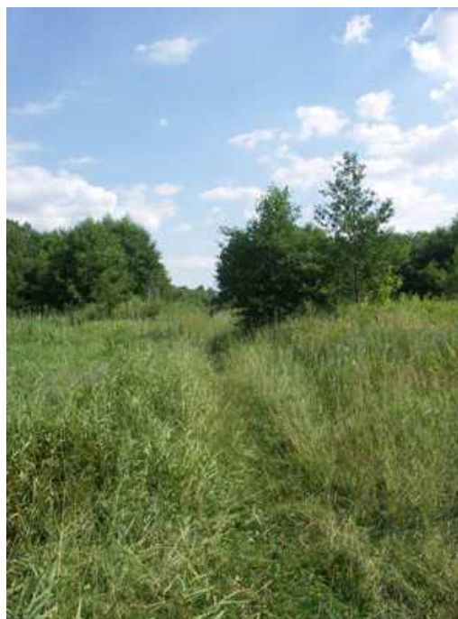
Fot. 4. Ścieżka przez łąki w dolinie Rawki