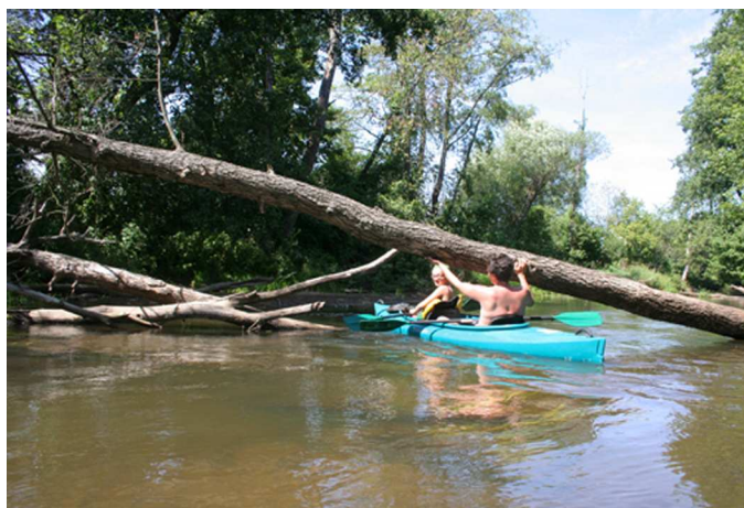
Fot. 7. Spływ Rawką jest nieco uciążliwy

Kajakowy spływ Rawką można uznać za trasę z pewnymi utrudnieniami, co wynika ze swoistej uciążliwości jego pokonania. Jest to związane z dużą liczą zwalonych drzew, które wymagają niekiedy bardzo częstego wysiadania z kajaka i przenoszenia go lub przeciągania przez zwalone drzewa. Jak dotąd, w niewielu miejscach utrudnienia te zostały zlikwidowane lub szlak udrożniony, co oceniono w niniejszym operacie jako cechę korzystną. Szansą na rozwój turystyki kajakowej jest bowiem ekoturystyka, wymagająca większego niż przeciętnie zaangażowania w pokonywanie tras turystycznych. Taka aktywność turystyczna sprzyja też ograniczeniu ruchu turystycznego Rawką, gdyż dla wielu osób trasa ta jest zbyt uciążliwa.