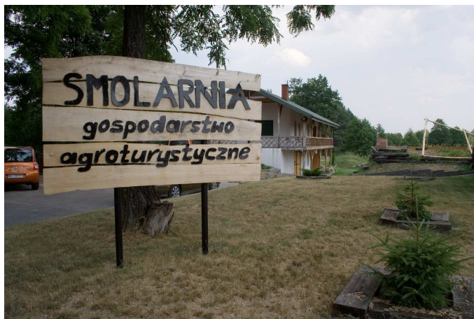
Fot. 12. Gospodarstwo agroturystyczne

Baza noclegowa na terenie Parku reprezentuje na ogół niski i średni standard. Podniesienie standardu w ostatnich latach było związane z przekształceniami własnościowymi. Stopień wykorzystania bazy turystycznej nie jest wysoki i wynosi około 25-30% w skali roku przy pełnym wykorzystaniu miejsc w sezonie letnim. Na wzrost ruchu turystycznego niewątpliwym wpływ będzie miała budowa autostrady A2 oraz modernizacja drogi nr 8 do parametrów drogi ekspresowej.