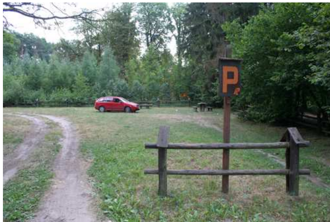
Fot. 9. Parking przy leśniczówce Ruda

Wśród 15 parkingów żaden nie jest wyposażony w takie urządzenia, jak: kosze na śmieci, stoły, ławy, miejsca na ognisko, sanitariaty. Infrastruktura parkingów usytuowanych tuż przy granicy Parku nie jest wystarczająca. Większość oznaczonych na mapie parkingów nie jest oznaczona w terenie lub trudna do zlokalizowania. Brak także drogowskazu do kempingu tuż przy leśniczówce Ruda. W niektórych miejscach, jak przy rezerwacie „Ruda-Chlebacz”, Tartaku Bolimowskim i Prochowym Młynku widoczne są nowe elementy wyposażenia wprowadzone przez Park w postaci zadaszanej tablicy z ławeczką.