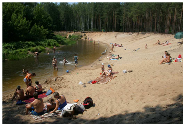
Fot. 14. „Dziki” kąpielisko „Oberwanka”

W lipcu 2006 r. przeprowadzono na terenie BPK wstępne badanie ankietowe dotyczące analizy ruchu turystycznego. W wyniku przeprowadzonego rozpoznania wynika, iż większość rekreantów to ludzie mieszkający w obrębie Parku lub w jego bliskim sąsiedztwie (Skierniewice, Żyrardów). Znaczną grupę stanowiły osoby preferujące bierny wypoczynek: plażowanie, biwakowanie, krótkie spacerunki. Są to przede wszystkim osoby w wieku emerytalnym, a także opiekunowie z dziećmi. Nieznaczną grupę stanowiły osoby uprawiające aktywną turystykę rowerową lub pieszą.