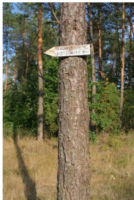
Fot. 3. Słabe oznakowanie szlaków w BPK

Utrudnienia - Szlak jest dobrze oznaczony na odcinku Nieborów - Budy Grabskie, ale dalej do Wycześniaka oznaczenia są wyblakłe i występują sporadycznie; zorientować się w terenie pomagają oznaczenie dróg pożarowych - tu numer 8. Brak jest tablic i oznaczeń traktów historycznych (Trakt Budnicki, Łowicki). Wzdłuż całej trasy brak urządzeń sprzyjających odpoczynkowi, jak ławki, wiaty turystyczne, ale także podstawowych elementów infrastruktury, jak śmietniki.