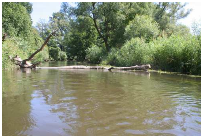
Fot. 1. Koryto Rawki – jeden z głównych walorów Parku

Do najciekawszych zbiorowisk leśnych należą grądy, dąbrowy i lasy łęgowe nieczęsto spotykane na Mazowszu. Dominują jednak bory sosnowe i mieszane sprzyjające rekreacji (płody runa leśnego).