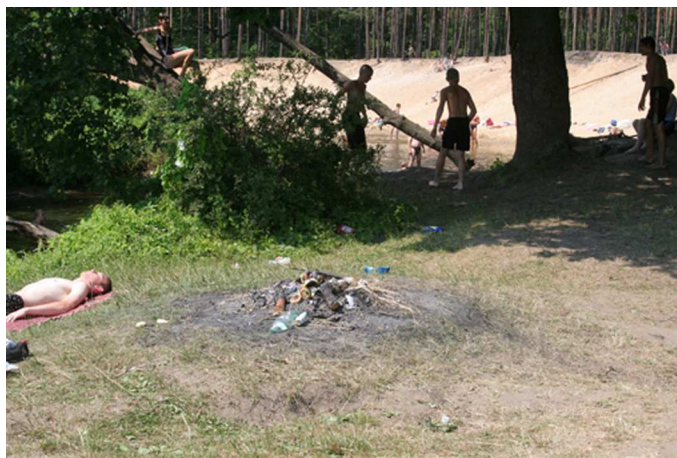
Fot. 15. Brak infrastruktury turystycznej przy „dzikim” kąpielisku „Oberwanka”

W dolinie Rawki zaznacza się wyraźnie sezonowe, nadmierne wykorzystanie rekreacyjne. Dotyczy to występowania licznych „dzikich” kąpielisk, które zlokalizowane są w granicach rezerwatu, tj. w pasie 10 m od rzeki oraz niektórych zbiorników wodnych (Balaton, Ziemiary). Również tutaj akceptacja takiego sezonowego wykorzystania tych obszarów wymaga systemowego rozwiązania, tak aby ograniczyć sytuacje konfliktowe, w tym przede wszystkim nadmierną degradację brzegów cieków i zbiorników.