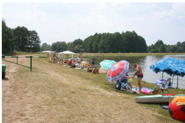
Fot. 13. Zbiornik Joachimów-Ziemiary

Zestawienie osób wypoczywających nad Rawką w lipcu 2006 r. wskazuje, że dane podawane w poprzednim Planie ochrony z 1998 r. mogą być nadal aktualne. Zwracano w nim uwagę, że wzdłuż Rawki od Rudy do Bolimowa w letni pogodny dzień przebywa 2 – 3 tys. turystów. W roku 2006 (dane zbierano w trakcie 1 godziny, w wybranych miejscach dwukrotnie, np. przy Oberwance) dane zebrane w ciągu dwóch dni były niemal identyczne, tak więc szacunek liczby turystów jest zbliżony do tego sprzed 10 lat. Jak wspomniano jednak, obserwacje terenowe wskazują, że jednocześnie w kompleksach leśnych niemal nie spotyka się turystów pieszych.