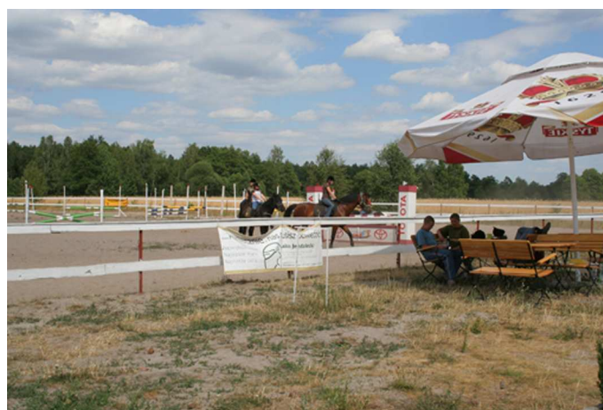
Fot. 5. Ośrodek jeździecki w rejonie Józefowa

Trasy konne są poprowadzone poprawnie, czyli w sposób nie kolizyjny ze szlakami turystycznymi oraz ścieżkami dydaktycznymi.