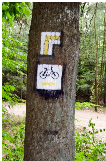
Fot. 6. Dobre oznaczenie szlaku rowerowego w rejonie Bud Grabskich

Szlak rowerowy żółty - Skierniewice Rawka PKP – Budy Grabskie - Nieborów (ok. 20 km): od Bud Grabskich (stąd oznaczenia żółtego szlaku) szlak prowadzi przez Białe Błoto w pobliżu rezerwatu „Kopanicha”, przez Puszcę Bolimowską oraz Las Nieborowski, dalej Traktem Budnickim przez Karczew - z otwarciem widokowym na polanę Olszówka, przez Piaski do Nieborowa. Szlak powrotny z Nieborowa do Bud Grabskich prowadzi w kierunku południowym - po drodze otwarcie widokowe na polanę Siwica. W miejscu przecięcia się szlaku żółtego ze szlakiem niebieskim pojawia się błędne oznakowanie szlaków. Dalej szlak prowadzi Drogą Łowicką - na trasie pojawia się tablica informacyjna prowadząca do punktu poboru wody, „dzikiego” kąpieliska tzw. „Balatonu”. Z przewodnika turystycznego wynika, że szlak żółty prowadzi również do miejscowości Skierniewice Rawka PKP. Jak wspomniano, z obserwacji terenowych wynika, iż szlak jest miejscami nie oznakowany, brak jest tablic informacyjnych, miejsc postojowych, a odcinek Budy Grabskie - Ruda jest piaszczysty i miejscami trudny do pokonania. Ponadto, na niektórych odcinkach szlak żółty pokrywa się z wytyczonym szlakiem zielonym, co może przyczyniać się do dezorientacji turystów. Wywiady przeprowadzone ze spotkanymi rowerzystami (8 osób) wskazują na wysoki stopień zadowolenia z wytyczenia tego typu szlaku. Szlak został odnowiony w sierpniu 2006 r.