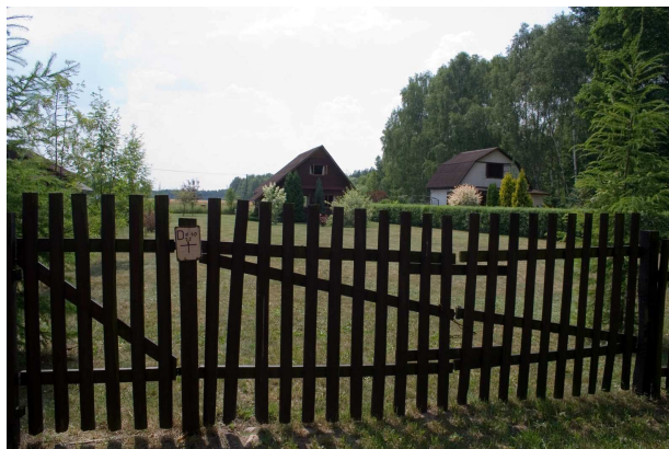
Fot. 10. Kompleks letnisk w Joachimowie Mogiłach